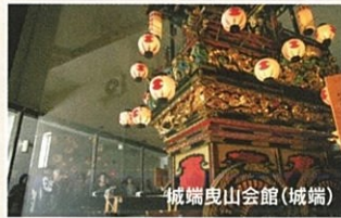
城端曳山会館(城端)