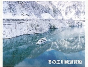
冬の庄川峡遊覧船

「JR城端駅」「井波(交通広場)」を拠点に、世界遺産・五箇山&白川郷、JR金沢駅、JR新高岡駅(北陸新幹線停車駅)へのアクセスが可能!