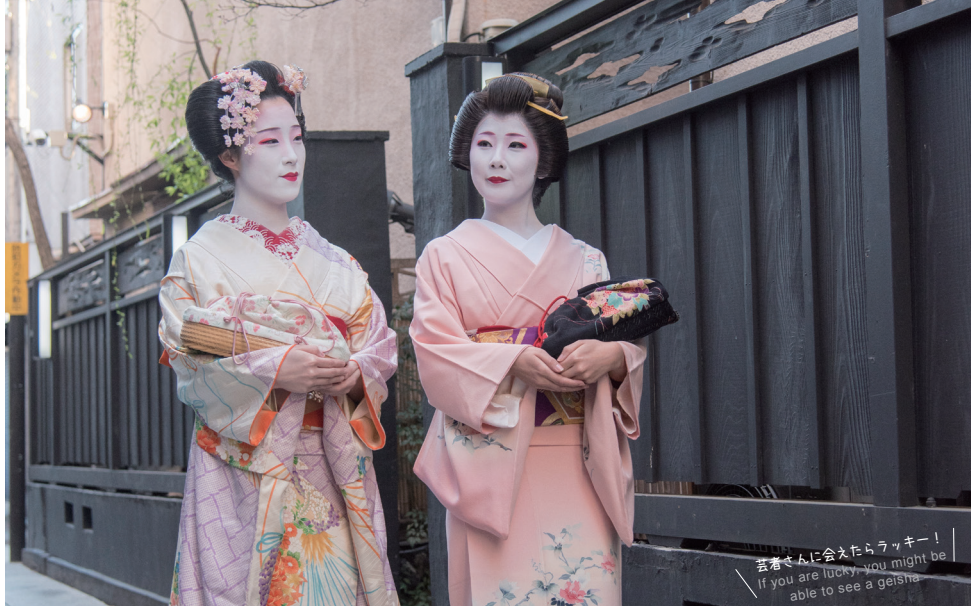
芸者さんに会えたらラッキー！ If you are lucky, you might be able to see a geisha.