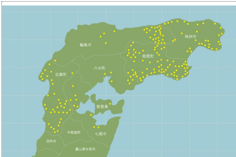
キリコ祭りの分布(能登全体を照らし出す)

キリコ祭りとは総称されているものの、それぞれの祭りを見ると全く多種多様である。キリコ祭りが各集落に広がるにつれ、集落の威信をかけた行事として、地域同士でキリコの大きさ、装飾、数や祭りの威勢の良さなどを競い合うようになった。50基以上の多数のキリコが担ぎ出されるもの、重さ4トン・屋根12畳分とキリコの巨大さを誇るもの、キリコに人形が組み付けられたもの、勇ましい武者絵が描かれたもの、キリコが海中で乱舞するもの、30mにもなる柱松明を練り回るもの、御輿を川の中で叩き付けたり、火の中に投げ込むもの、女性ばかりでキリコを担ぐもの、担ぎ手が派手な色柄の「どてら」を着込むもの、勇壮な太鼓や狂言が演じられるもの、国指定の風光明媚な海岸や神社を背景に練り回り、風情ある空間を作り出しているもの、とそれぞれに卓越した特徴があるので、どれか一つを観れば、キリコ祭りの大要が掴めるというものではない。したがって、一つに留まらず、複数のキリコ祭りを「ラリー」するのもまた一興である。