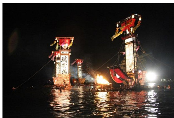
19. 宝立七夕キリコまつり