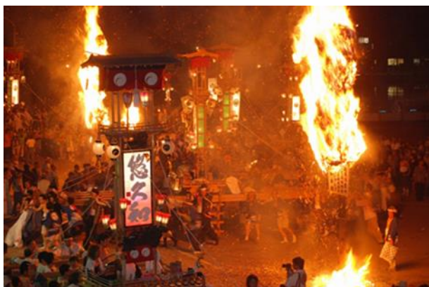
あばれ祭り (宇出津のキリコ祭り)