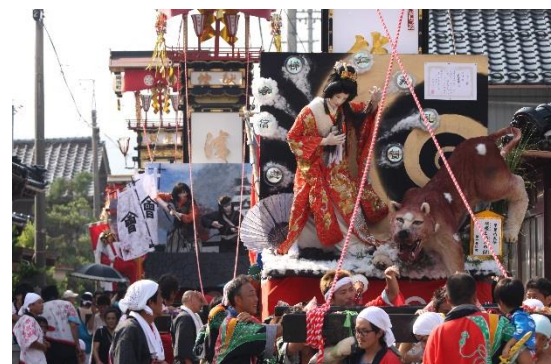
29. 松波人形キリコ祭り