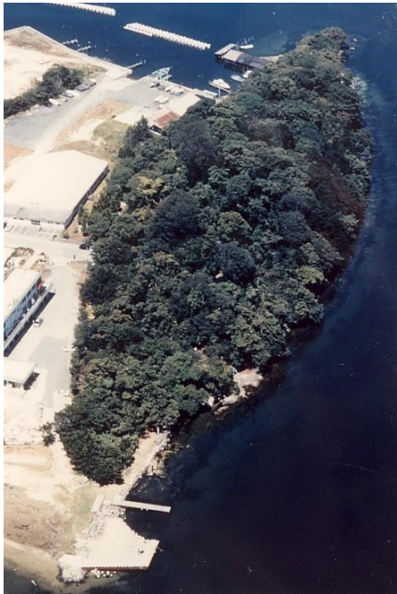
4. 唐島神社社叢タブ林