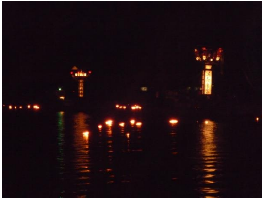
3. 塩津かがり火恋祭り