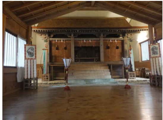
6. 藤津比古神社本殿