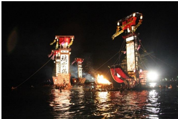
宝立七タキリコ祭り

国内を見渡して、これほどまでに灯籠神事が集積をした地域は唯一無二。夏、能登を旅すればキリコ祭りに必ず巡り会えると言っても過言ではなく、それはキリコが供奉する神々に巡り会う旅ともなるのである。