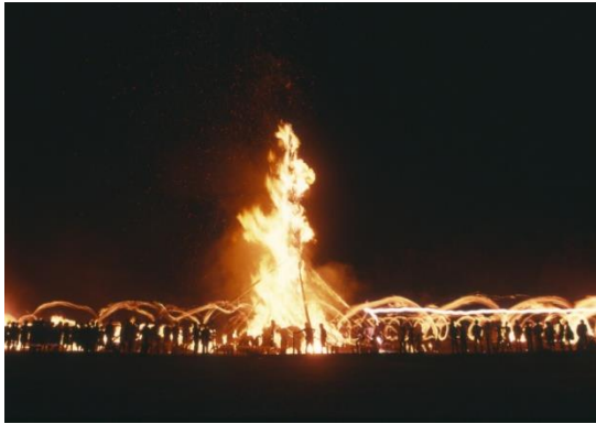
1. 能登島向田の火祭