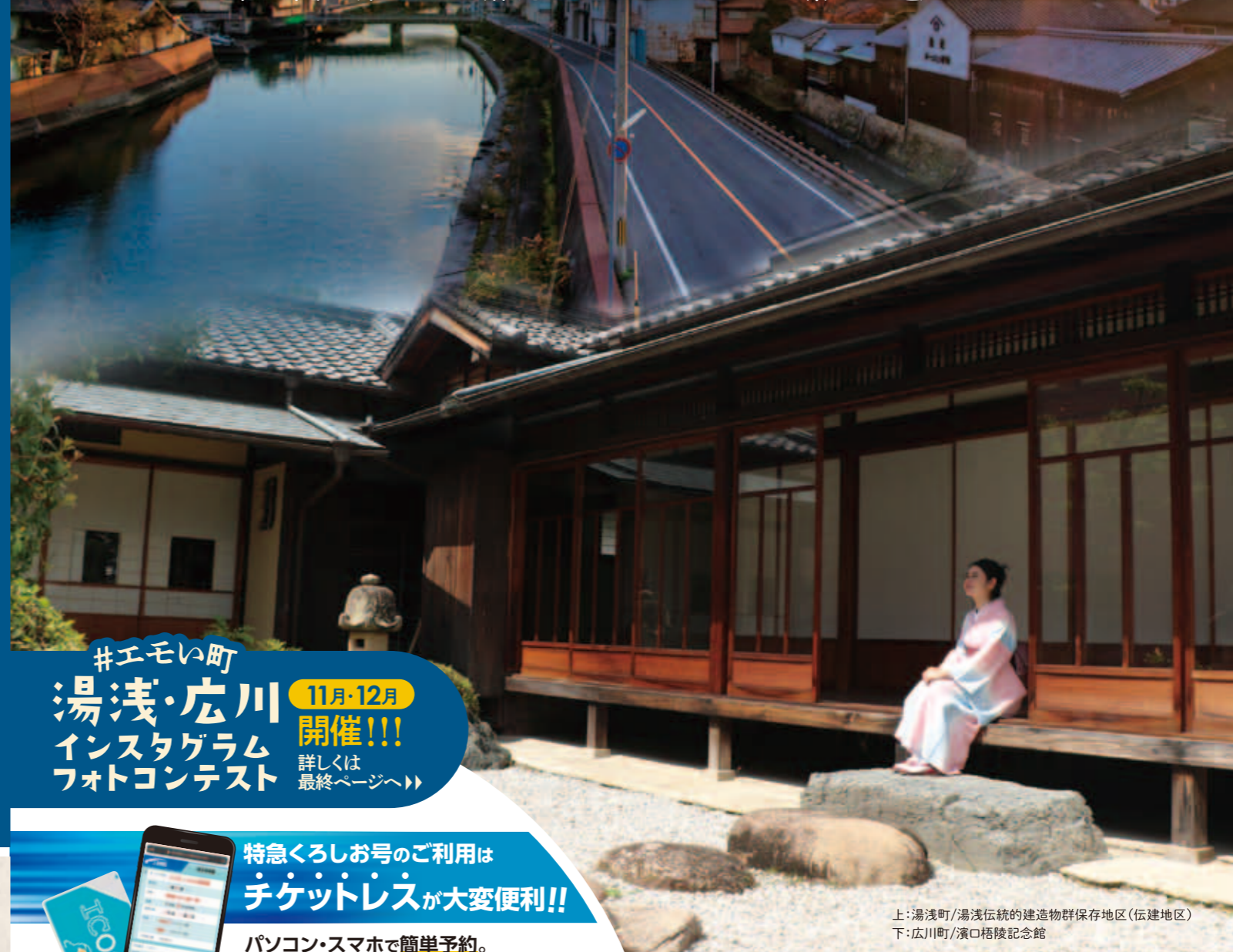
上:湯浅町/湯浅伝統的建造物群保存地区(伝建地区) 下:広川町/濱口梧陵記念館

#エモい町 湯浅・広川 Instagram フォトコンテスト 11月・12月 開催!!! 詳しくは 最終ページへ▶▶