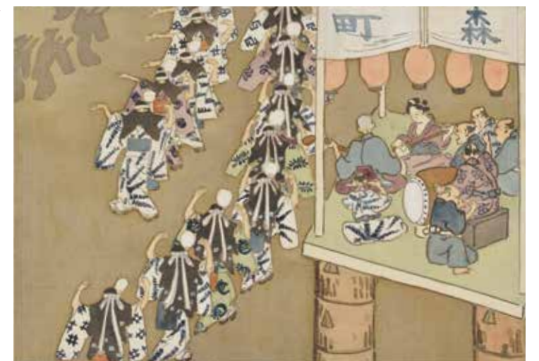
津和野百景図 第九十九図 盆踊