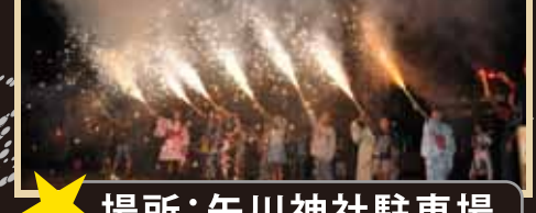
★ 場所: 矢川神社駐車場