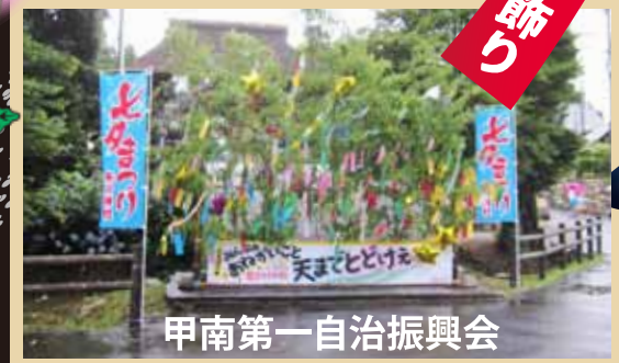
甲南第一自治振興会