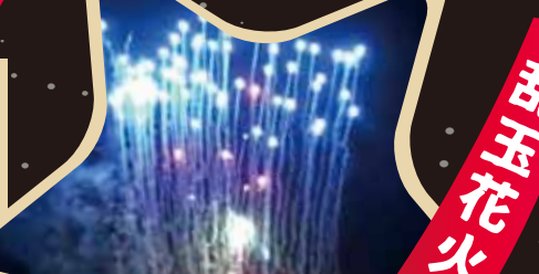
★ 初 甲南第一自治振興会 矢川神社参道横