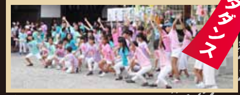
★ 場所: 太鼓橋まえ