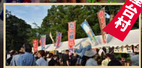
★ 場所: 矢川神社境内