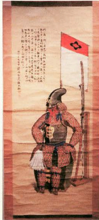
熊田恰愛用の甲冑と野太刀の絵