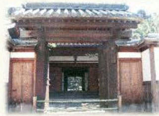
「御成門」特別通り抜け