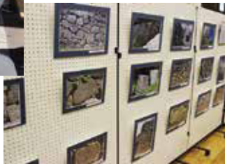
小豆島 刻印石パネル展示