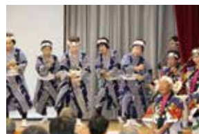
石節振興会 (小豆島)