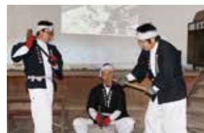
北木島石切唄保存会 (笠岡市)