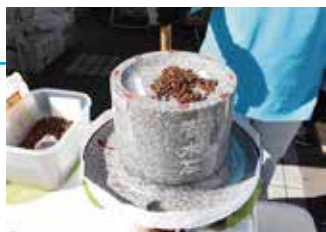
塩飽広島 青木石の石臼コーヒー (青木石材協同組合)

日本遺産「石の島」ならではの展示コーナーや、石臼で挽いたコーヒーをお楽しみください。