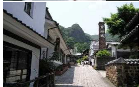
【〈上〉柿右衛門（濁手）・〈下〉大川内山の町並み】