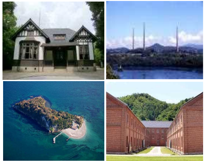
【〈左上〉 呉鎮守府司令長官官舎（呉市）・〈左下〉 東京湾要塞跡猿島砲台跡（横須賀市）・〈右上〉 旧佐世保無線電信所（針尾送信所）施設（佐世保市）・〈右下〉 舞鶴赤れんがパーク（舞鶴旧鎮守府倉庫施設）（舞鶴市）】

明治期の日本は、近代国家として西欧列強に渡り合うための海防力を備えることが急務であった。このため、国家プロジェクトにより天然の良港を四つ選び軍港を築いた。静かな農漁村に人と先端技術を集積し、海軍諸機関と共に水道、鉄道などのインフラが急速に整備され、日本の近代化を推し進めた四つの軍港都市が誕生した。百年を超えた今もなお現役で稼働する施設も多く、躍動した往時の姿を残す旧軍港四市は、どこか懐かしくも逞しく、今も訪れる人々を惹きつけてやまない。