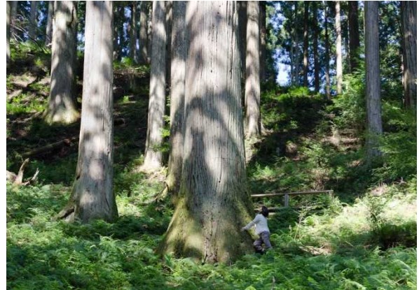
しもたこ 【下多古村有林】

ここに暮らす人々が、それらの森を長きに亘って育み、育まれる中で作り上げた食や暮らしの文化が今に伝わり、訪れる者はそれを体感して楽しむことができる。