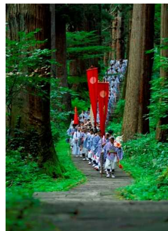
【羽黒山の石段と杉並木】

三山を巡ることは、江戸時代に庶民の間で『生まれかわりの旅』として広がり、地域の人々に支えられながら、日本古来の、山の自然と信仰の結び付きを今に伝えています。羽黒山の杉並木につつまれた石段から始まるこの旅は、訪れる者に自然の霊気と自然への畏怖を感じさせ、心身を潤し明日への新たな活力を与えます。