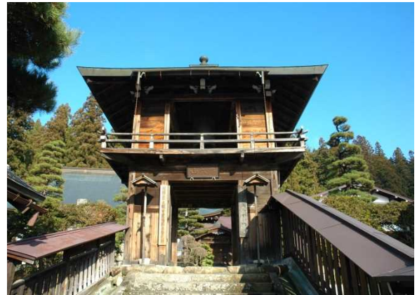
うんりゅうじしやうろうもん 【雲龍寺 鐘楼門】

これは私たちが木と共に生きてきた 1300 年の高山の歴史を体感する物語である。