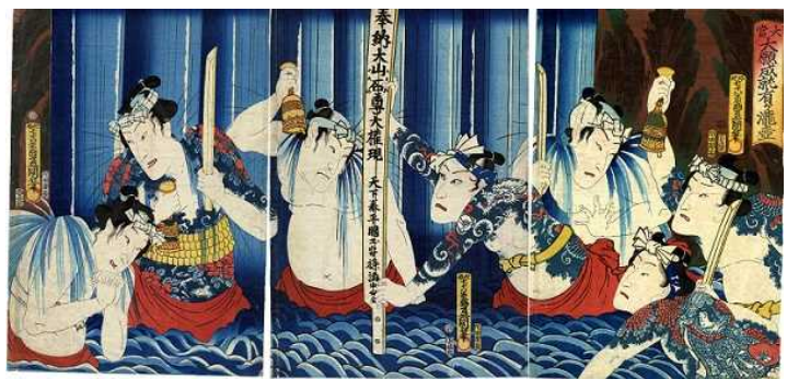
【浮世絵：歌川豊国「大當大願成就有が瀧壺」文久3（1863）年】

大山詣りは，今も先導師たちにより脈々と引き継がれている。首都近郊に残る豊かな自然とふれあいながら歴史を巡り，山頂から眼下に広がる景色を目にしたとき，大山にあこがれた先人の思いと満足を体感できる。