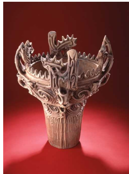
【国宝笹山遺跡出土火焰型土器】

日本一の大河・信濃川の流域は、8000年前に気候が変わり、世界有数の雪国となった。この雪国から5000年前に誕生した「火焰型土器」は大仰な4つの突起があり、縄文土器を代表するものである。火焰型土器の芸術性を発見した岡本太郎は、この土器を見て「なんだ、コレは！」と叫んだという。火焰型土器を作った人々のムラは信濃川流域を中心としてあり、その規模と密集度は日本有数である。このムラの跡に佇めば、5000年前と変わらぬ独特の景観を追体験できる。また、山・川・海の幸とその加工・保存の技術、アンギン、火焰型土器の技を継承するようなモノづくりなど、信濃川流域には縄文時代に起源をもつ文化が息づいている。火焰型土器は日本文化の源流であり、浮世絵、歌舞伎と並ぶ日本文化そのものである。