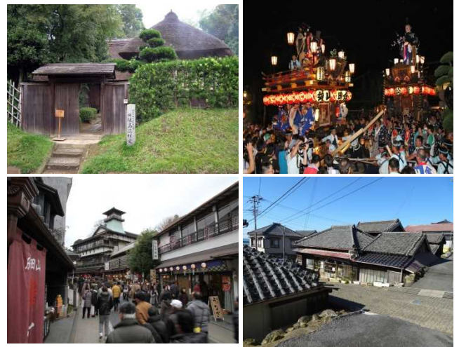
【〈左上〉佐倉市武家屋敷・〈左下〉成田山門前町（大野屋）・〈右上〉佐原の山車行事・〈右下〉銚子市外川の町並み】