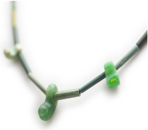
【八日市地方遺跡の玉づくり】

小松の人々は、弥生時代の へきぎょく 碧玉の玉づくりを始まりとして2300年にわたり、金や銅の鉱石、メノウ、オパール、水晶、碧玉の宝石群、良質の凝灰岩石材、九谷焼原石の陶石などの石の資源を見出し、時代のニーズに応じて、現代の技術をもってしても再現が困難な高度な加工技術を磨き上げ、ヤマト王権の諸王たちが権威の象徴として挙って求めるなど、人・モノ・技術が交流する豊かな石の文化を築き上げてきている。