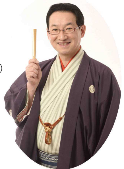
春風亭 昇太 師匠