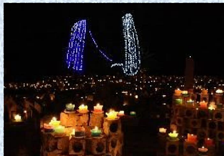
※大谷平和観音前での開催の様子