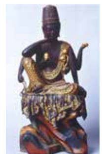
えんぎょうじ ろっぴにょらいかんぜおんぼさつ 園教寺と六臂如意輪観世音菩薩