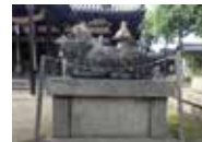
浜の宮天満宮の神牛

日本海や瀬戸内海沿岸には、山を風景の一部に取り込む港町が点々とみられます。そこには、港に通じる小路が随所に走り、通りには広大な商家や豪壮な船主屋敷が建っています。また、社寺には奉納された船の絵馬や模型が残り、京など遠方に起源がある祭礼が行われ、節回しの似た民謡が唄われています。これらの港町は、荒波を越え、動く総合商社として巨万の富を生み、各地に繁栄をもたらした北前船の寄港地・船主集落で、時を重ねて彩られた異空間として今も人々を惹きつけてやみません。