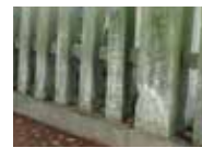
九所御霊天神社の玉垣