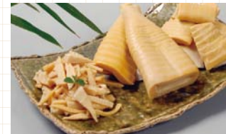
●松島町 / たけのこ

松島ブランド認定の商品をはじめ、3市町の美味しいグルメ、工芸品などを販売します！商品お買い上げの方を対象にハズレなしのお楽しみ抽選会もあります！是非お立ち寄りください。