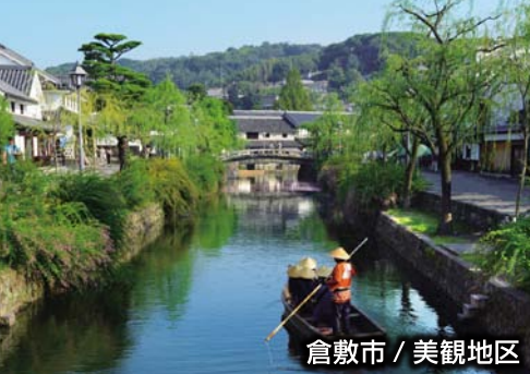
倉敷市 / 美観地区