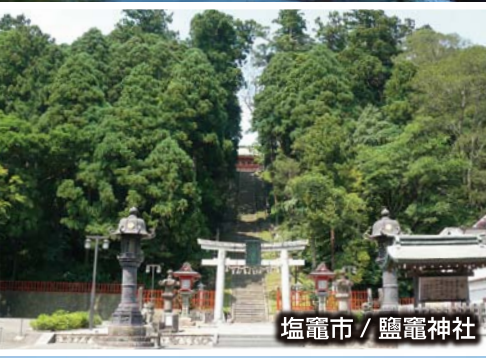
塩竈市 / 鹽竈神社