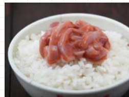
●塩竈市 / いか塩辛