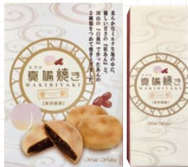
●倉敷市 / 真備焼き