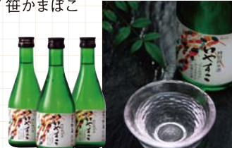
●松島町 / いやすこ