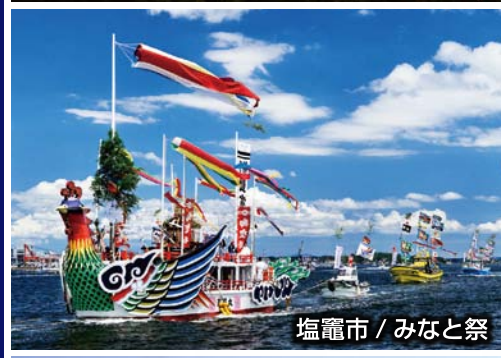
塩竈市 / みなと祭