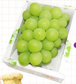
●倉敷市 / マスカット・オブ・アレキサンドリア