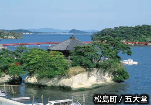
松島町 / 五大堂