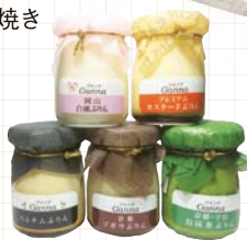
●倉敷市 / ジャンナプリン