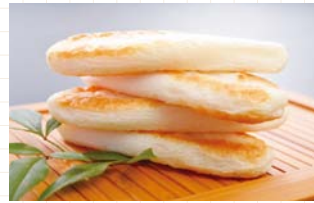
●塩竈市 / 笹かまぼこ