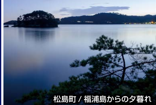
松島町 / 福浦島からの夕暮れ