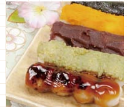
●松島町 / いぶき庵