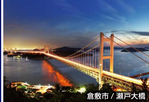
倉敷市 / 瀬戸大橋