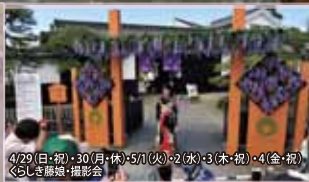
4/29(日・祝)・30(月・休)・5/1(火)・2(水)・3(木・祝)・4(金・祝) くらしき藤娘・撮影会