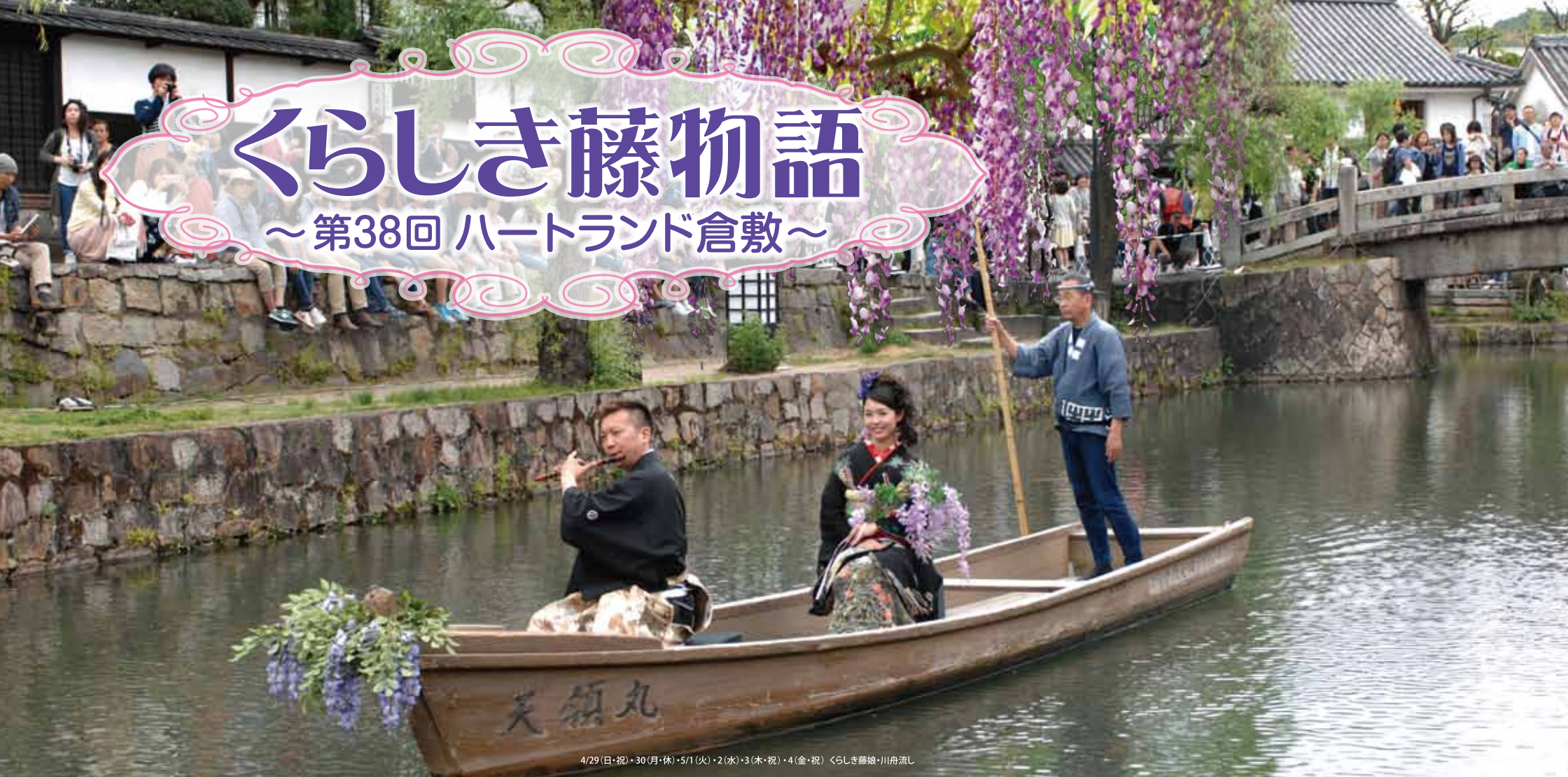
4/29(日・祝)・30(月・休)・5/1(火)・2(水)・3(木・祝)・4(金・祝) くらしき藤娘・川舟流し