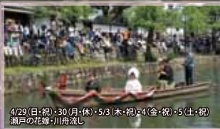
4/29(日・祝)・30(月・休)・5/3(木・祝)・4(金・祝)・5(土・祝) 瀬戸の花嫁・川舟流し