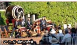
5/5(土・祝) 倉敷天鏡太鼓