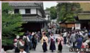
5/3(木・祝) 商店街2丁目カムハレ一下