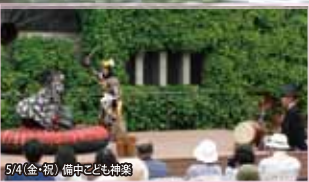
5/4(金・祝) 備中ごども神楽