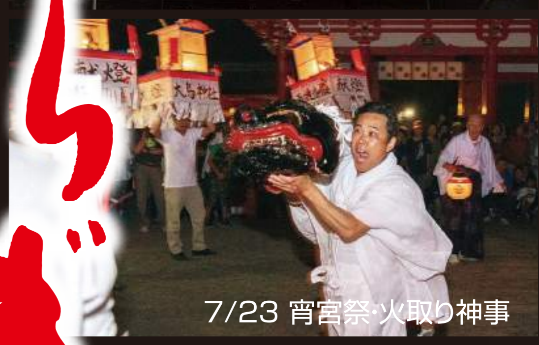
7/23 宵宮祭・火取り神事