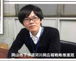
岡山市下水道河川局広報戦略推進班