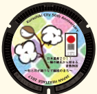
マンホール缶バッジ