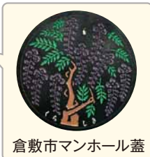
倉敷市マンホール蓋

16:00 ~ 16:30 エンディング マンホールサミット倉敷宣言 マンホール蓋 (実物) 抽選会