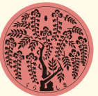
開催記念コースター