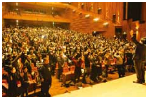
トークは毎回大盛り上がり!

マンホール蓋の面白トークをメインとし、グッズ販売や実物展示の他、様々なイベントを通してマンホール蓋を知り、楽しみ、それをきっかけに下水道に関心を持ってもらうためのイベント!今回は、日本のマンホール蓋が世界に誇れる文化物である事を広げる為、文化の華を咲かせる街「倉敷市」で開催!参加費無料で記念品もたくさんあるので是非参加してマンホール蓋を楽しむ人(マンホーラー)になろう!