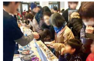
グッズ販売は毎回大盛況!!