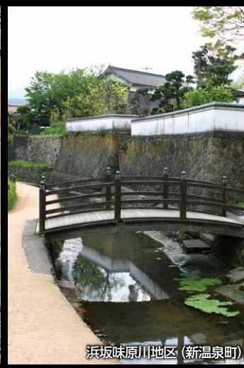
浜坂味原川地区 (新温泉町)