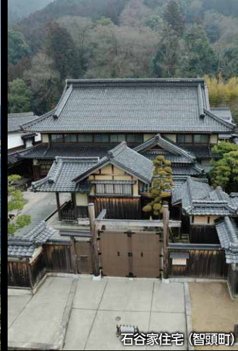
石谷家住宅 (智頭町)