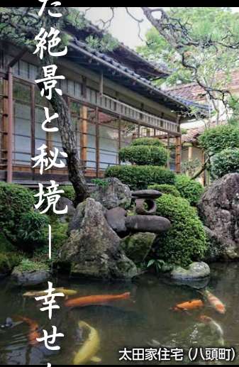
太田家住宅 (八頭町)