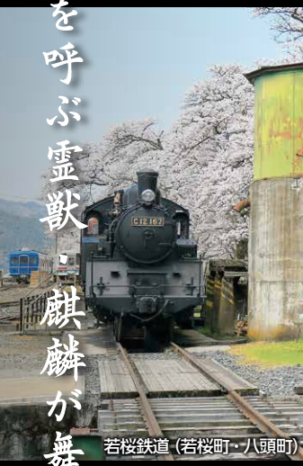
若桜鉄道 (若桜町・八頭町)