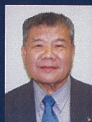
湯浅町長 上山 章善氏

お問合せ 最初の一滴プロジェクト事務局 03-6458-3327(平日のみ10:30～16:00)