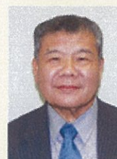
湯浅町長 上山 章善氏

大阪府出身。和歌山大学経済学部卒。2006年読売テレビ入社。2015年読売テレビを退社しフリーに。現在は「1周回って知らない話」(日本テレビ系)、「この差って何ですか?」(TBS系)、「びったんこカンカン」(TBS系)、「FIELD OF DREAMS」(TOKYO FM)などに出演中