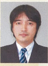
和歌山大学副学長 足立 基浩氏

大阪市出身。高校2年生の時「ピアの肖像」で第1回講談社新人漫画賞受賞、その後プロ活動に入る。代表作に「あした輝く」「アリエスの乙女たち」「海のオーロラ」「あすなろ坂」「狩人の星座」「天上の虹」など。2006年に全作品及び文化活動に対し文部科学大臣賞受賞、2010年文化庁長官表彰受賞、2013年度「マンガ古典文学古事記」古事記出版大賞太安万侶賞受賞、2014年外務大臣表彰受賞。 公社)日本漫画家協会常務理事(一社)マンガジャパン代表/NPOアジアマンガサミット運営本部代表等。