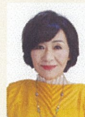
マンガ家・大阪芸術大学教授 里中 満智子氏

近茶流嗣家。東京農業大学醸造学科卒業後、小豆島のしょうゆ会社の研究員として勤務。現在、東京・赤坂の料理教室にて、日本料理、茶懐石研究指導にあたる。NHK「きょうの料理」やテレビ朝日「おかずのクッキング」などテレビ出演の他、NHKドラマ「みをつくし料理帖」、大河ドラマ「龍馬伝」などの料理監修、時代考証を数々手がける。2015年文化庁文化交流使に任命され、約3ヵ月の間諸外国をまわり、日本料理を広める活動を行う。