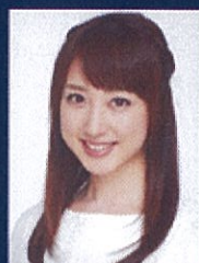
フリーアナウンサー 川田 裕美氏