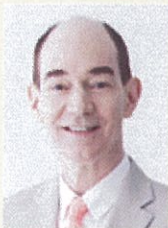
日本文学研究者・ 国文学研究資料館長 ロバート キャンベル氏

専門は江戸・明治時代の文学、特に江戸中期から明治の漢文学、芸術、思想などに関する研究を行う。 テレビでMCやニュース・コメントーター等をつとめる一方、新聞雑誌連載、書評、ラジオ番組出演など、さまざまなメディアで活躍中。主な番組出演は「スッキリ」(日本テレビ系)、「Face to Face」MC (NHK国際放送) 他