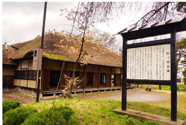
2 松ヶ岡開墾場本陣