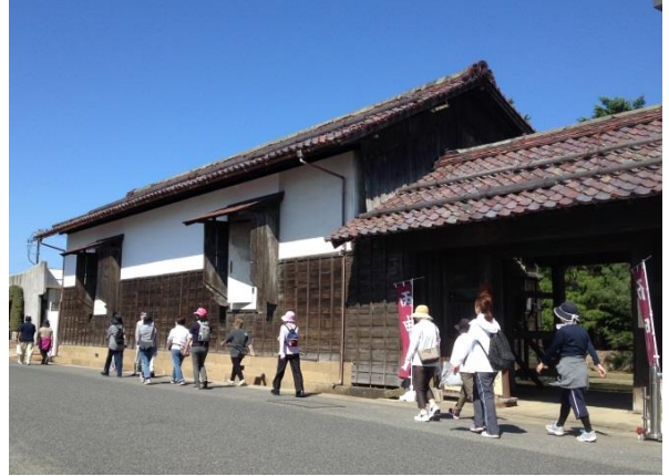
8 風間家旧宅 表門(国登録)