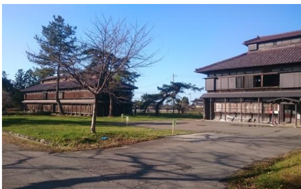
3 松ヶ岡開墾場蚕室群