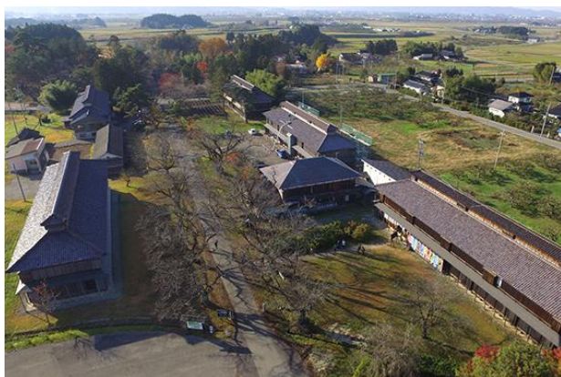
1 松ヶ岡開墾場(国史跡)