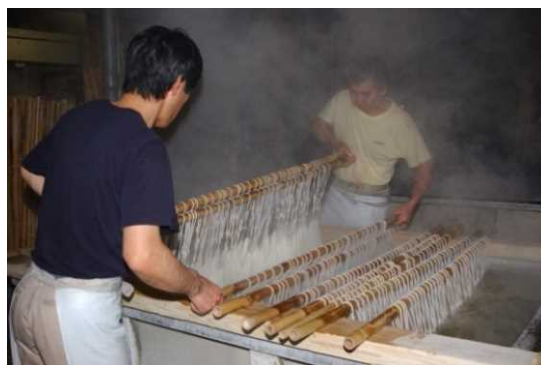
羽前絹練(株)精練作業風景

このように、鶴岡市では、近代化の礎となった絹産業の歴史と文化を保存継承し、近代化の原風景が貴重な歴史遺産として残されているとともに、現在は、絹の新たな文化価値や創造性溢れる産業を創出するため、市民、地域、行政が連携して「鶴岡シルクタウン・プロジェクト」に取り組んでおり、鶴岡で生まれた絹糸の新たな活用として kibiso が、改めてジャパンシルクを世界に発信しています。