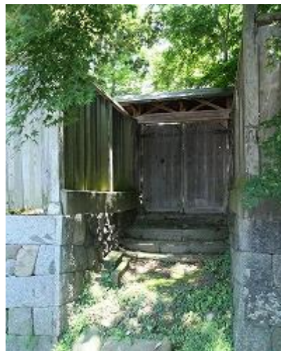
14 風間家旧別邸 北門(国登録)