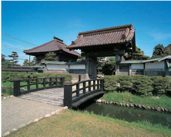
19 庄内藩校致道館(国史跡)