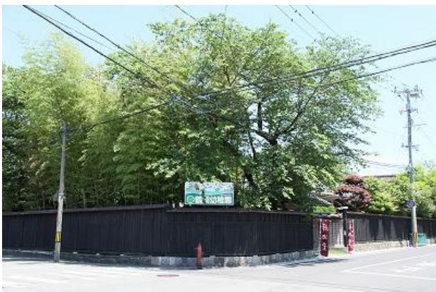
15 風間家旧別邸 板塀(国登録)