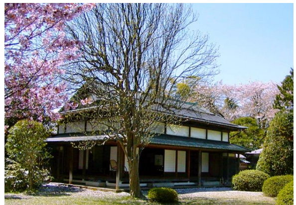
10 風間家旧別邸 無量光苑釈迦堂(国登録)