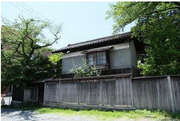
11 風間家旧別邸 土蔵(国登録)