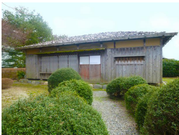
5 松ヶ岡開墾士住宅(市有形)