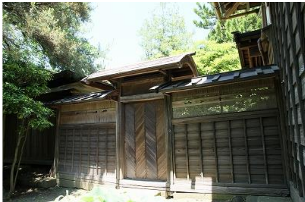
13 風間家旧別邸 中門(国登録)