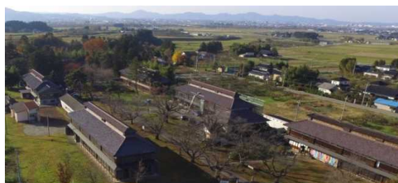
現存する国内最大級の養蚕群

日本の近代化を産業面から牽引した絹産業。旧庄内藩士が刀を鋤に持ち替えたことが、鶴岡市を中心とする庄内地域が国内最北限の絹産地となったきっかけでした。この地域は、国内の絹産業が時代とともに衰退する中で、百数十年を経た今もなお、養蚕から絹織物の製品化まで一貫した工程が残る国内唯一の地です。