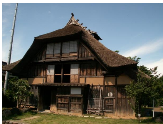
16 旧渋谷家住宅(国重文)