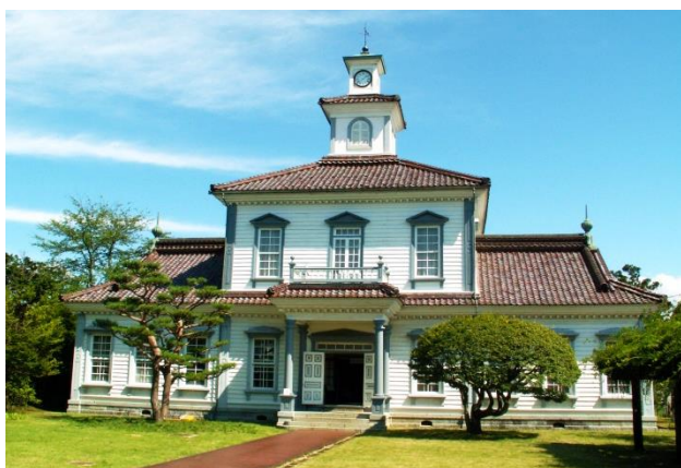
17 旧西田川郡役所(国重文)