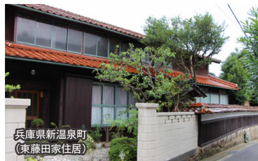
兵庫県新温泉町 (東藤田家住居)