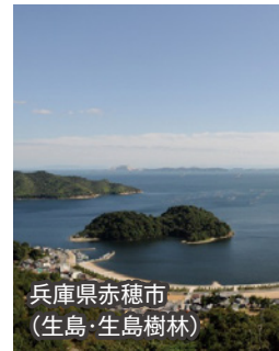
兵庫県赤穂市 (生島・生島樹林)