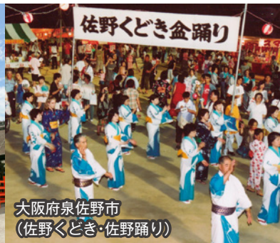
大阪府泉佐野市 (佐野くどき・佐野踊り)

日程 2022年9月30日(金) 18時半～21時 Zoomによるオンライン開催 要事前申込 無料