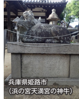
兵庫県姫路市 (浜の宮天満宮の神牛)