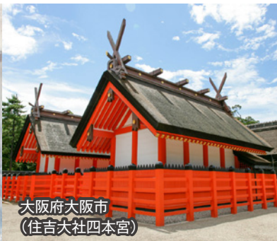
大阪府大阪市 (住吉大社四本宮)