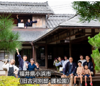
福井県小浜市 (旧古河別邸・護松園)