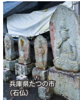
兵庫県たつの市 (石仏)