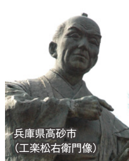
兵庫県高砂市 (工業松右衛門像)