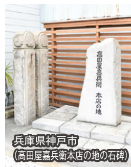
兵庫県神戸市 (高田屋嘉兵衛本店の地の石碑)