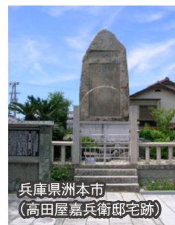
兵庫県洲本市 (高田屋嘉兵衛邸宅跡)