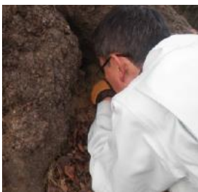
2016（平成28）年に実施された染井吉野の樹齢調査。放射性炭素年代測定のための木材採取の様子。

日本に咲くサクラの約8割は染井吉野とされている。その中でも、現存する染井吉野の幹として一番古いものが郡山の地で今もなお咲き誇り、人々の心を和ませてくれている。