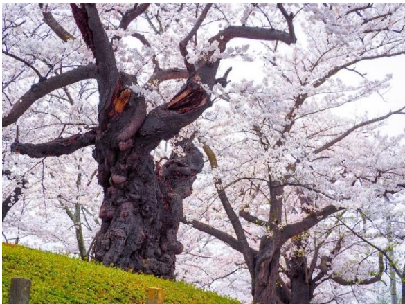
140年以上、開拓の心を伝え続ける染井吉野。

「染井吉野」は江戸時代末期に染井村（現在の東京都豊島区）から供給され広まった単一クローンの栽培品種で、元々一つだった木から挿し木や接ぎ木で増やした品種。