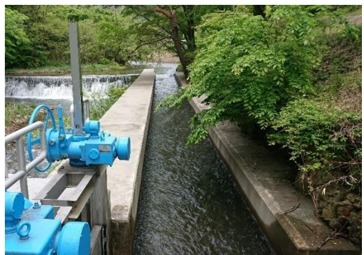
日本三大疏水のうち最初に実施された安積疏水開削事業により造られた水路。熱海町を通る一級河川「五百川」の流れを利用し水を運ぶ。

この明治政府初の国营農業水利事業は、猪苗代湖の水を治め、米や鯉など食文化を豊かにし、さらには水力発電による紡績等の新たな産業の発展をもたらした。未来を拓いた「一本の水路」は、多様性と調和し共生する風土と、開拓者の未来を想う心、その想いが込められた桜とともに、今なおこの地に受け継がれている。これら地域のストーリーは、2016（平成28）年に日本遺産に認定された。