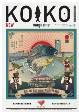
安積疏水の完成により使われなくなった溜池を利用し盛んになった鯉の養殖。