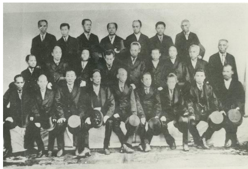
1873（明治6）年、県の開拓に呼応し地元商人たちで結成された開成社。社則には、開拓を進めた池や道路沿いに花木を植えることが定められていた。

その後、桜の木は見事な大木となり、1934（昭和9）年には国の史蹟名勝天然記念物に指定されるほどに至った（現在は解除）。