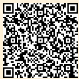
応募受付フォーム

https://www.e-hyogo.elg-front.jp/hyogo/uketsuke/form.do?id=1685510517466