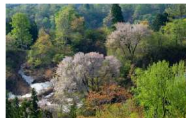
雪国の究極の春景色