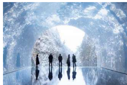
豪雪地の美ものがたり（清津峡） マ・ヤンソン/MAD アーキテクト「Tunnel of Light」