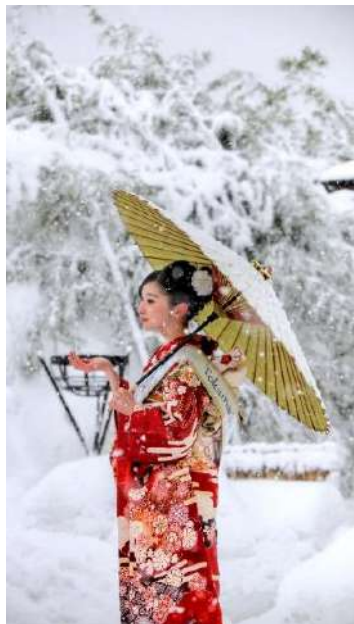
豪雪地の着ものがたり

世界有数の豪雪地として知られる十日町市。ここには豪雪に育まれた「着もの・食べもの・建もの・まつり・美」のものがたりが揃っている。人々は雪と闘いながらもその恵みを活かして暮らし、雪の中に楽しみさえも見出してこの地に住み継いできた。ここは真の豪雪地ものがたりを体感できる究極の雪国である。