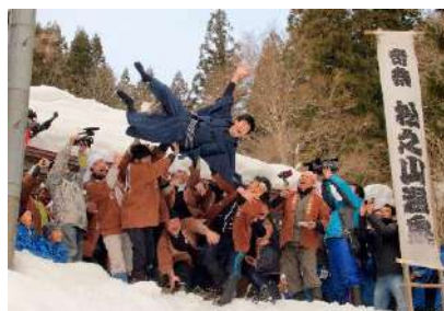
豪雪地のまつりものがたり（婿投げ）