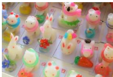
節季市の名物「チンコロ」