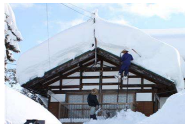
屋根雪を除く作業「雪堀り」

このように無雪期と積雪期とで別世界が出現する中、人々の暮らしは営々と続けられてきた。人々は、雪と闘い、雪を受け入れ、雪を活用し、雪に親しみ、雪に楽しみさえも見出して生き抜いてきたのである。十日町市は、豪雪とともに生きる暮らしと豪雪を友とする心が、縄文時代から受け継がれて今に息づく「究極の雪国」である。ここで日本文化の深奥ともいえる真の「豪雪地ものがたり」を体感してほしい。