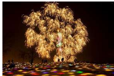
越後妻有雪花火／Gift for Frozen Village