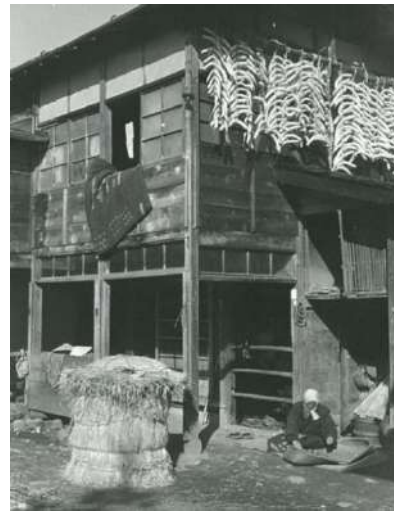
12 ダイコダテ・芋穴 (冬季の食料保存の知恵)