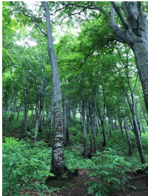
33 天水山麓のブナ原生林