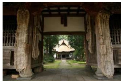
豪雪地の建ものがたり（神宮寺）