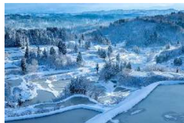
雪解け水を用いる棚田

豪雪地では、雪で大地がふさがれる期間が4月頃まで続く。そのため植物の芽吹きは遅くなり、積雪期は土を耕す農業もできない。この長い冬を凌ぐため、人々は秋までに採れた食料を備蓄し活用することにことのほか心を砕いた。山菜やキノコは塩に漬けたり干したりしておく。大根などの野菜は、ワラで覆い雪の中で保存すると凍らず長持ちした。また、「雪穴」や「雪室」に大量の雪を貯めておき、夏になるまで食料の冷蔵に利用した。