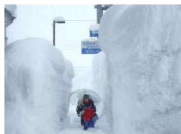
豪雪時の登校の様子