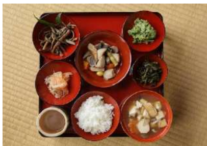
豪雪地の食べものがたり