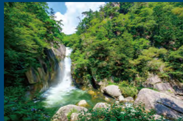
渓流と一体になった美しい風景が、訪れた人を楽しませる。