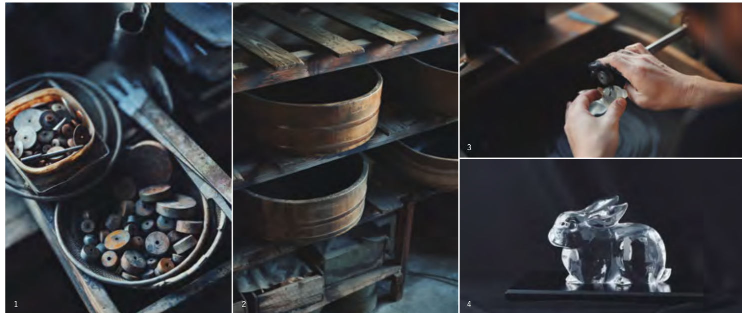
1 | コマと呼ばれる木製の先端工具を使い分けながら、思い描く形状に加工する。 2 | 水晶の研磨には研磨剤の金剛砂が使われる。長年使い込まれた桶の中には粒度の異なる金剛砂と水が入っている。「削り」「磨き」の工程で少しずつ粒度を細かくしていく。 3 | 昔ながらの細工台を使った加工が特徴。 4 | やわらかみのある立体彫刻が生まれる。完成まで約3か月を要する製品も。

ですが、それを職人の手でやわらかいフォルムに作り変えていきます。無機質な物質が、人の手のぬくもりを感じられる製品に変わっていくことに、水晶加工の醍醐味があります。工程を簡略化せず、金剛砂を使った昔ながらの製法で加工することが、当社のこだわりです。この技術を次の時代に伝承していくことが、私たちの使命だと思っています。