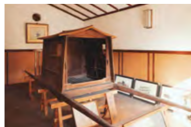
常説寺の前身は弘仁14年(823)に建立された台嶺山園乗寺。参道の一の鳥居内にある最初の折願所として修験者たちが訪れた。また、承久の乱の後、順徳上皇が金櫻神社へ勅使を遣わした際に奉納品を載せた「白輿」が残されている。