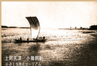
土阿久津 小輪飼船 @さくら市ミュージアム