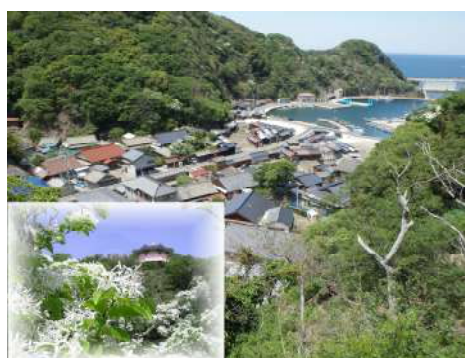
(13) 鰐浦(朝鮮通信使寄港地、ヒトツバタゴ自生地)