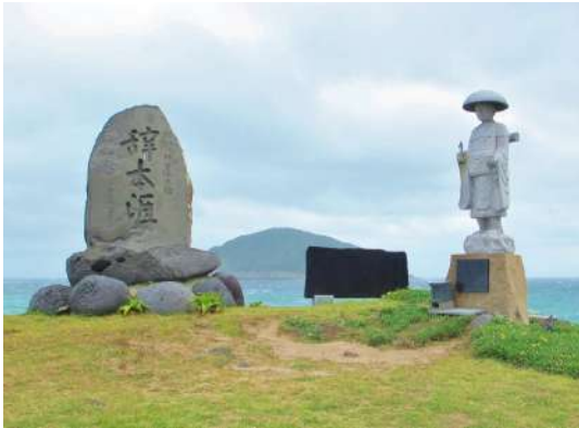
(1) 三井楽(みみらくのしま)