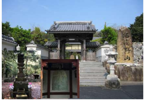
(4) 大宝寺(西高野山、五重の層塔、梵鐘)