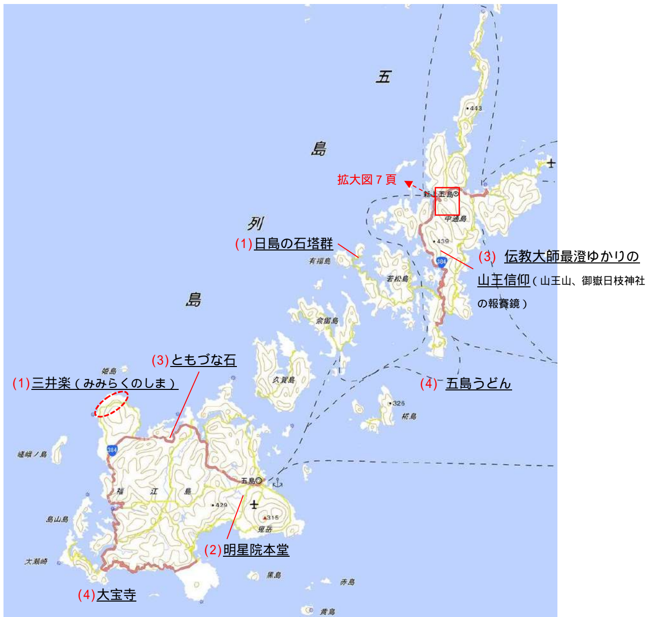
国土地理院の電子地形図に文化財名等を追記して掲載