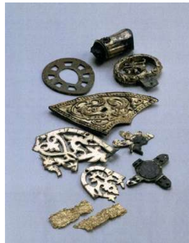
(5) 長崎県双六古墳出土品