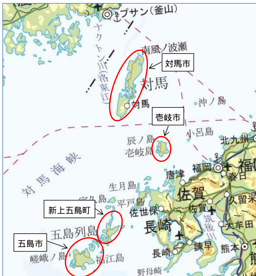
国土地理院の電子地形図に市町名等を追記して掲載