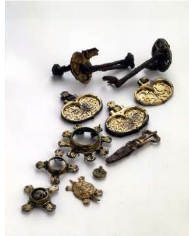
(4) 長崎県笹塚古墳出土品