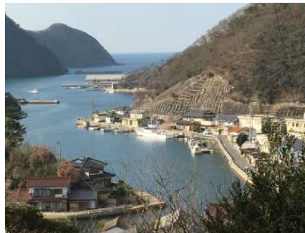
(12) 佐須奈港(佐須奈日向改番所跡)