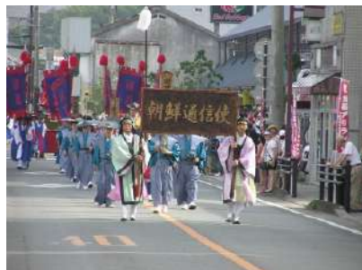
朝鮮通信使行列の再現

室町時代の対馬は、島主・宗氏を中心に日本と朝鮮との間で外交の実務と貿易を独占してきたが、豊臣秀吉の朝鮮出兵により一変し、国交は断絶した。長年、朝鮮との貿易に島の経済を頼ってきた対馬にとって、朝鮮との国交回復、貿易復活は死活問題であった。対馬藩は、朝鮮との国交回復交渉を行い、その間、日朝双方の国書を偽造するなど危ない橋を渡りながら、ようやく江戸時代最初の朝鮮通信使来日に成功する。その後、朝鮮貿易の復活も