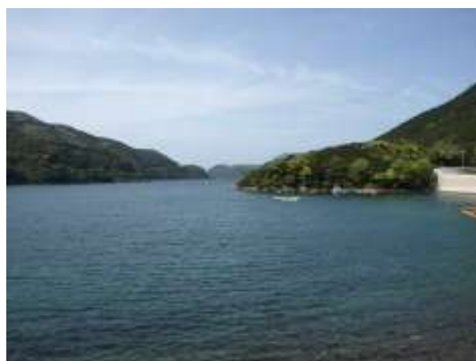
(2)-4・5 錦帆瀬、三日ノ浦