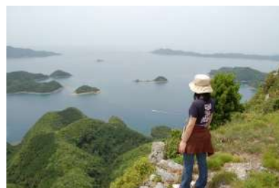
金田城跡の山頂から国境の海を望む

千年以上も昔と変わらぬ東シナ海の大海原を目の前にすると、この地を最後に異国へと旅だった人々と送り出す家族の覚悟や想い、弘法大師空海の「辞本涯」(本涯 = 日本の果て)の言葉が、時代を超えてこだまする。