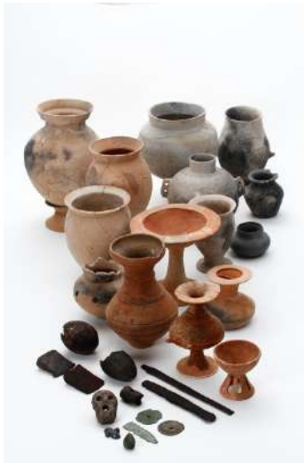
(2) 長崎県原の辻遺跡出土品