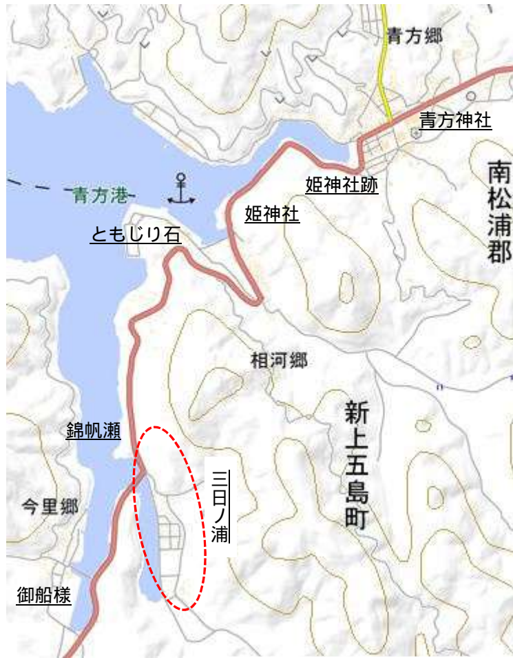
国土地理院の電子地形図に文化財名等を追記して掲載