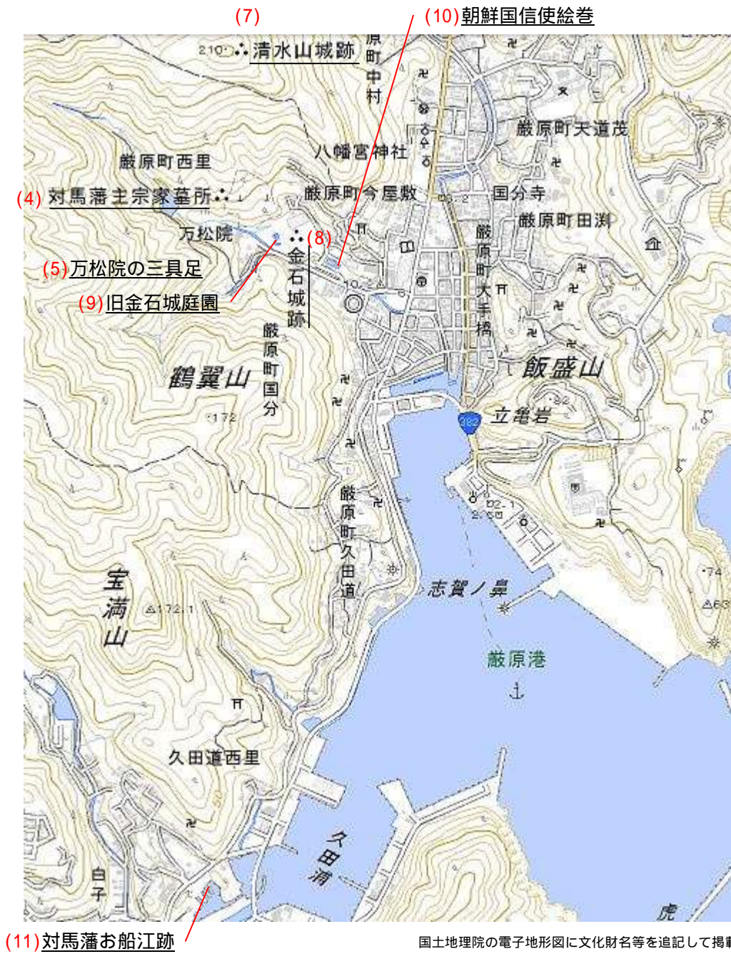
国土地理院の電子地形図に文化財名等を追記して掲載