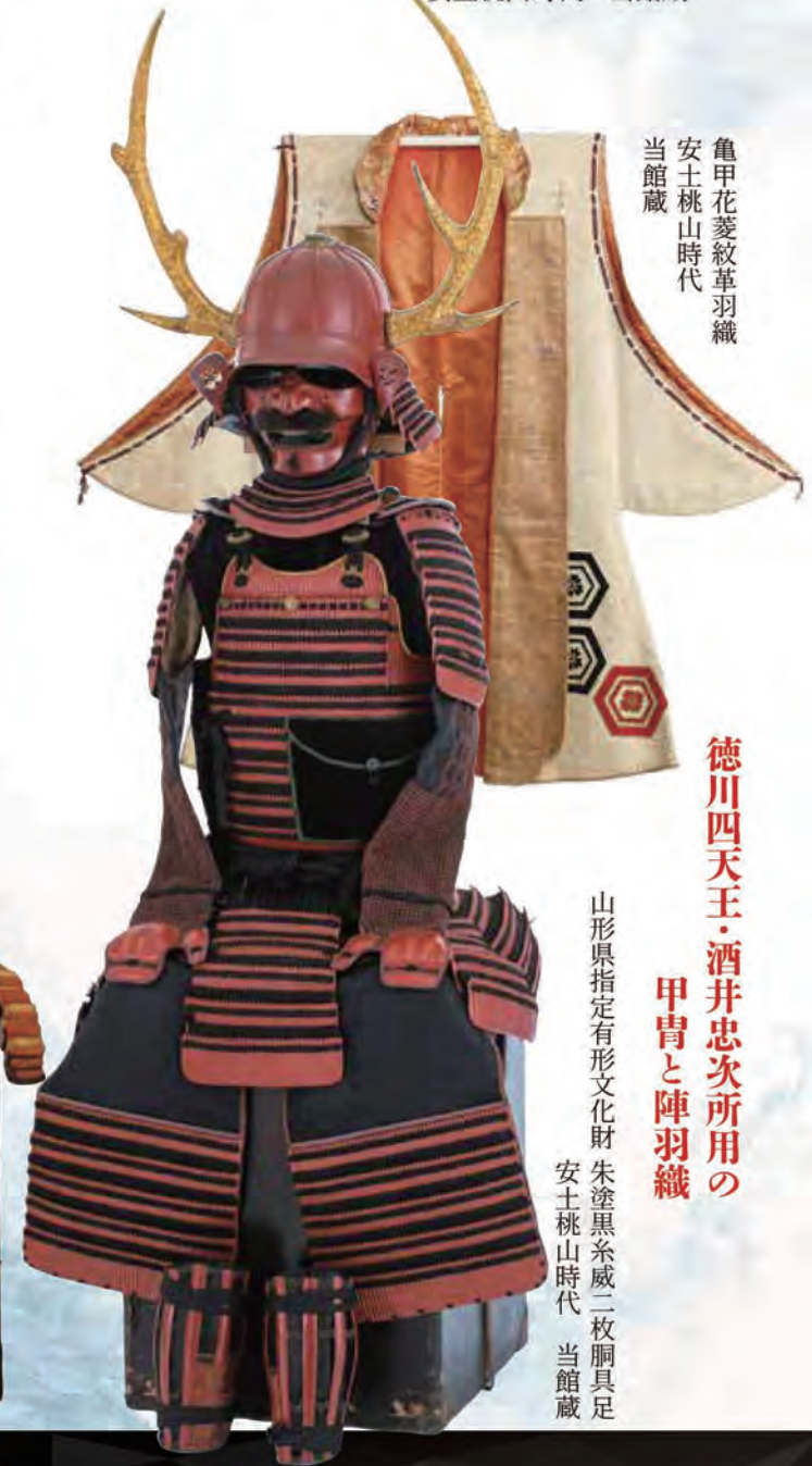
亀甲花菱紋革羽織 安土桃山時代 当館蔵