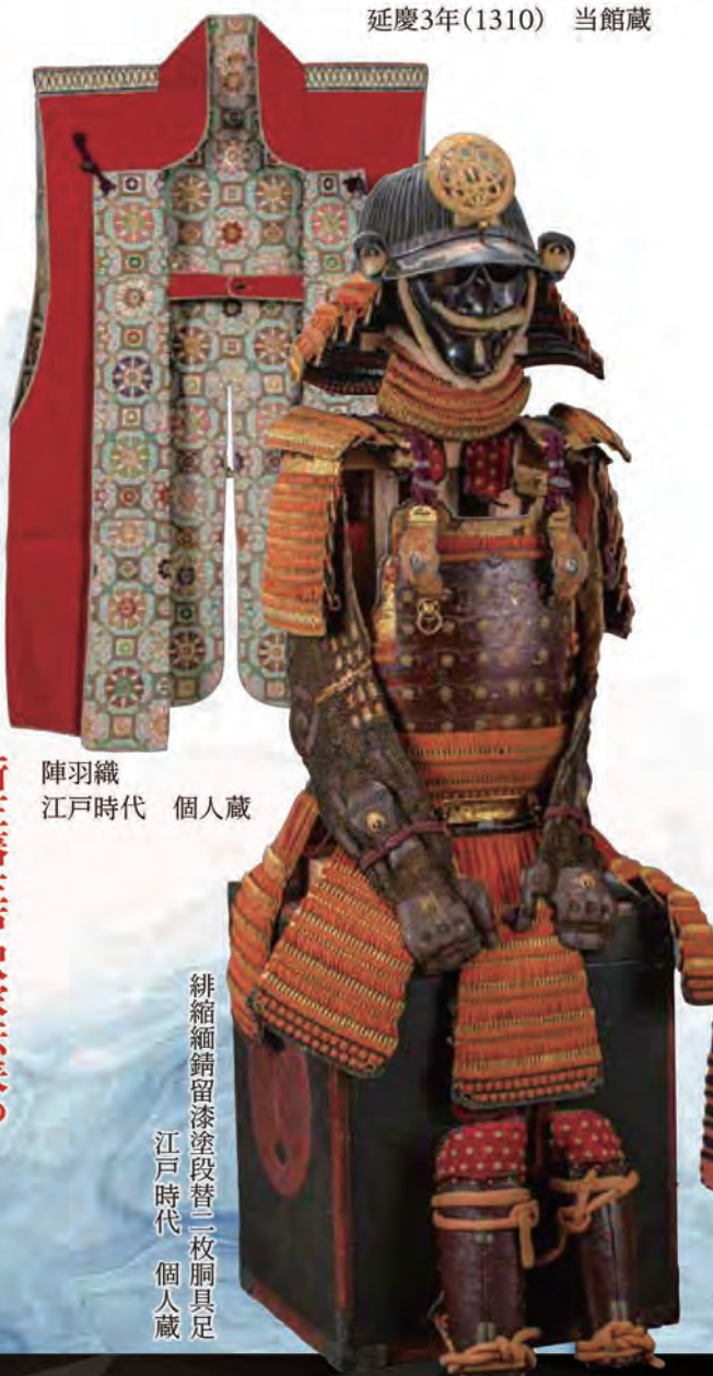
陣羽織 江戸時代 個人蔵