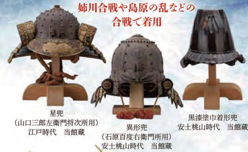
星兜 (山口三郎左衛門将次所用) 江戸時代 当館蔵 異形兜 (石原百度右衛門所用) 安土桃山時代 当館蔵 黒漆塗巾着形兜 安土桃山時代 当館蔵