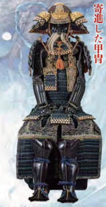
庄内藩家老 酒井玄蕃了恒が 寄進した甲冑